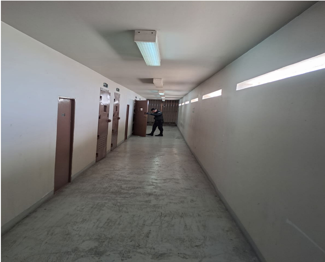
Celda 404: lugar donde habitan encerrados todos los imputados desde las 8.30 a las 17.30 horas aprox.